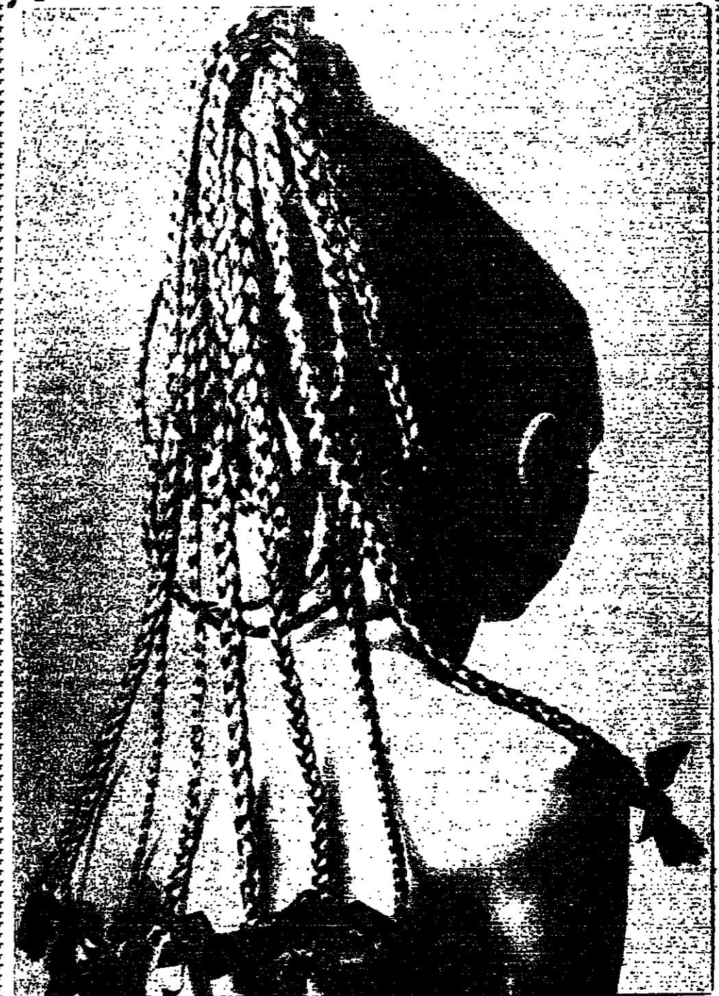
عادت موضة تصفيف الشعر القديمة المعروفة (بالثينون) - وهي عبارة عن الضفائر الطويلة المجدولة - الى الظهور ثانية في باريس . وفي الصورة حسان تصفف شعرها بالطريقة الجديدة - القديمة . ومهما كان الشعر قصيرا فان من الممكن اجراء هذه التصفيقة بالامتانة بالشعر الاصطناعي